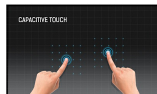
Touch technology - Capacitive

Dit touchscherm kan ook worden bediend wanneer voorzet glas (max. 6mm) voor het scherm wordt geplaatst waardoor het scherm verandert in een interactief glazen oppervlak. Een ideale oplossing voor bijvoorbeeld wayfinding in beurzen of musea, retail of restaurants. Het is uitermate geschikt om foto's, video's, pdf-bestanden, plattengronden, flyers, websites en overige informatiebronnen op weer te geven en te zoeken.