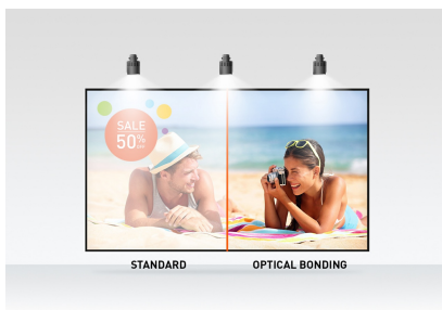
Optical bonded PCAP

Met de Optical Bonded Projective Capacitive (PCAP) 10 punts Touch-technologie levert de ProLite TF2438MSC-B1 een naadloze en accurate Touch ervaring. Deze Full HD (1920x1080) Open Frame monitor met IPS-paneeltechnologie garandeert een uitzonderlijke kleurechtheid en hoog contrast vanuit elke kijkhoek. Een robuuste metalen behuizing en krasbestendig 7H edge-to-edge glas met anti-vingerafdruk coating maken de monitor bijzonder geschikt voor integratie in veeleisende omgevingen. Bovendien voldoet de monitor aan een IPX1 beschermingswaardering, waardoor hij waterdicht is voor gedurende tijd tegen druppelend water en is de display beschermd tegen vochtigheid en mogelijke vochtontwikkeling. De ProLite TF2438MSC-B1 kan worden gebruikt in landscape, portrait and face-up oriëntatie. Een perfecte oplossing voor kiosksystemen, detailhandel en interactieve digitale signage installaties.