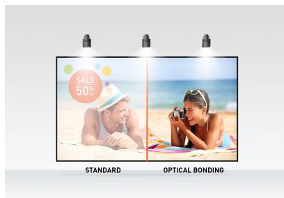
PCAP sa optičkim vezama

Full HD (1920x1080) Open Frame monitor ProLite T2438MSC-B1 sa IPS tehnologijom panela nudi izuzetne boje i široke uglove gledanja. Optical Bonded Projective Capacitive (PCAP) tehnologija dodira sa 10 tačaka obezbeđuje besprekoran i precizan odgovor na dodir i nižu refleksiju svetlosti, pored toga, ekran je zaštićen od vlage i potencijalnog razvoja vlage. Robusno metalno kućište i 7H staklo od ivice do ivice otporno na ogrebotine sa premazom protiv otisaka prstiju čine monitor posebno pogodnim za integraciju u zahtevnim okruženjima. Monitor takođe ispunjava IPX1 stepen zaštite, što ga čini voodootpornim tokom određenog vremenskog perioda od kapanja vode. ProLite TF2438MSC-B1 se može koristiti u pejzažnom, portretnom i položaju okrenutom nagore. Savršeno rešenje za sisteme reklamnih panela, maloprodajne i interaktivne digitalne reklamne instalacije.