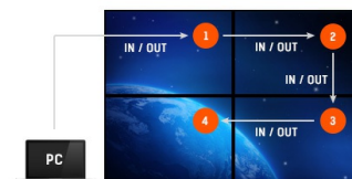
Support en Daisy Chain

La technologie AMVA3 offre un contraste plus élevé, des noirs plus sombres et les angles de vision bien meilleurs que la technologie traditionnelle TN. L'image aura l'air bien quel que soit l'angle sous lequel vous la regardez.