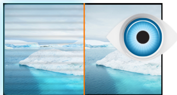
Flicker free + Blue light

The ProLite B2283HS-B3 is an excellent 22" Full HD LED-backlit monitor with 1920 x 1080p resolution. It features 1ms response time and 80 000 000 : 1 Advanced Contrast Ratio, assuring clear and vibrant picture quality and high contrast. Triple Input support ensures compatibility with the latest installed graphics cards and embedded Notebook outputs. The ergonomic stand offers 13 cm height adjustment with pivot and swivel, making this screen suitable for a wide range of applications and environments where workplace flexibility and ergonomics are key factors. The monitor is TCO Certified. A perfect solution for education, local government, business and finance markets.