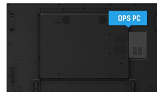
OPS PC SLOT

Las pantallas IPS son más conocidas por sus amplios ángulos de visión y sus colores naturales y precisos. Son particularmente adecuados para aplicaciones de color crítico.