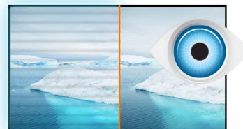
L'image sans scintillements + la réduction de la lumière bleue

Avec une résolution de 1920 x 1080 points, votre moniteur LCD est prêt pour afficher tous types d'images Haute Définition. Ceci signifie que vous avez une plus grande surface visible (environ 60 % de plus) par rapport à un moniteur à la définition traditionnelle de 1280 x 1024 points.