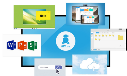
iiWare 8.0 (Android OS)

Delite, strimujte i uređujte sadržaj sa bilo kojeg uređaja direktno na ekranu i pretvarajte sastanke ili predavanja svog tima u laganu, brzu i neometanu interaktivnu sesiju sa uključenim WiFi modulom ( QWM001 ) i aplikacijom ScreenSharePro.