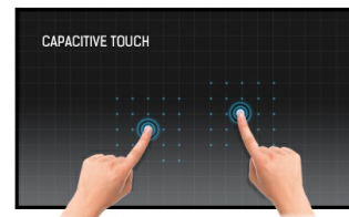
Dotyková technologie – kapacitní

IPS displays are best known for wide viewing angles and natural, highly accurate colours. They are especially suited for colour-critical applications.