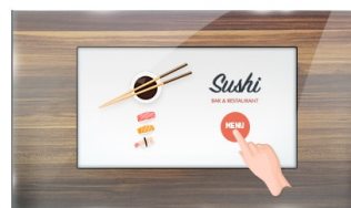
Тач через стекло

IPS дисплеи известны своими широкими углами обзора, естественными цветами и точной цветопередачей. Они особенно хорошо подходят для приложений по работе с цветом.