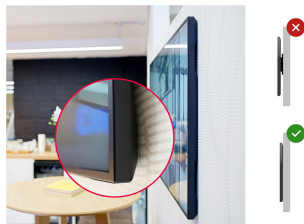
Zero-Gap Wall Mount

Designed to perform in continual, around the clock environments, the LH5570UHB can be installed and utilised in landscape and portrait orientation. The jaw dropping and best-in-class 35mm total depth (when used with the included proprietary brackets) will mean this display can be installed discreetly and elegantly in all areas.