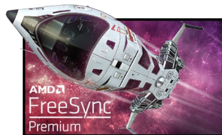
Technologie FreeSync™ Premium

La Résolution UHD (3840 x 2160), plus connu sous la dénomination 4K, vous offre une zone d'affichage gigantesque avec 4 fois plus d'espace d'information et de travail qu'un écran classique en Full HD. En raison de sa haute densité de points par pouce (DPI), il affichera des images incroyablement fines et pointues.