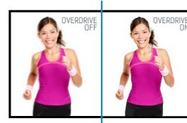
OverDrive ON / OFF

Deze techniek is niet afhankelijk van een extra touch-laag die vóór het LCD-paneel wordt geplaatst. Daarmee is het ongevoelig voor slijtage of beschadiging. Het (bijna) aanraken van het panel met een stylus of de vinger (met of zonder handschoen) volstaat. Deze infrarood touch-techniek garandeert optimaal beeld doordat door het ontbreken van een extra touch-plaat de beeldeigenschappen ongewijzigd blijven.